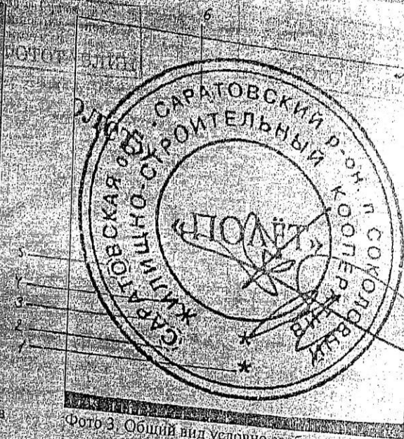
Фото 3. Общий вид условно свободного образца оттиска печати ЖСК «Полет»