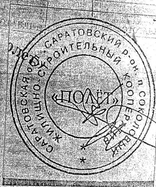
Фото 5. Контрольный фотоснимок общего вида условно свободного образца оттиска печати ЖСК «Полет»

Примечание: на фото 2-3 красителем синего цвета одноименными цифрами отмечены различающиеся признаки.